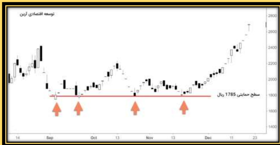
شکل ۳-۳ سطح حمایتی در تکنیکال در نمودار شرکت سرمایه‌گذاری توسعه اقتصادی آراین

۴- سطح حمایت حاصل اتصال نقاط پایینی، روی یک خط در طی یک بازه‌ی زمانی می‌باشد.