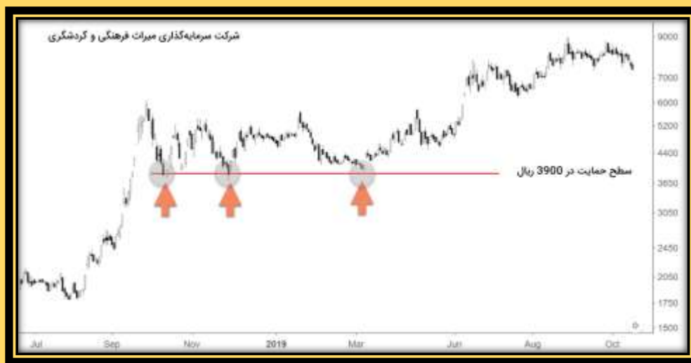
شکل ۲-۳ سطوح حمایت در تکنیکال در نمودار شرکت سرمایه‌گذاری میراث فرهنگی و گردشگری

از مهم‌ترین مفاهیمی که در روانشناسی عرضه و تقاضا در بازار وجود دارد، ترازهای حمایت و مقاومت است. در واقع این سطوح مرتبط با سطوحی از قیمت‌ها می‌باشند که در نزدیکی حمایت، معامله‌گران مایل به خرید و در نزدیکی مقاومت، تمایل به فروش سهام خود دارند.