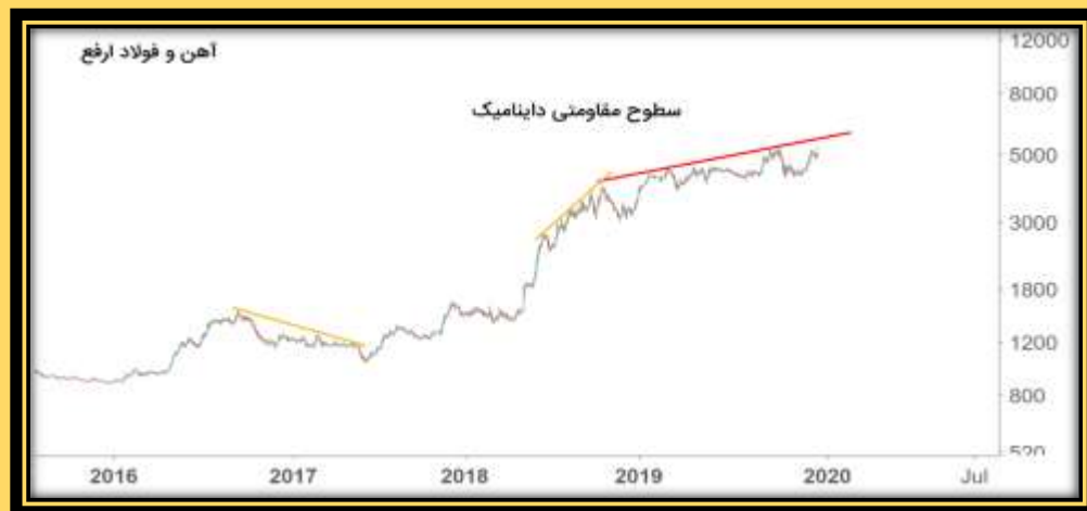
شکل ۳-۵ سطوح مقاومتی داینامیک

علاوه موارد بالا که سطوح حمایتی و مقاومتی به صورت افقی بود و استاتیک گفته میشود این سطوح میتوانند مورب نیز باشند که در این حالت به آن ها داینامیک میگویند.