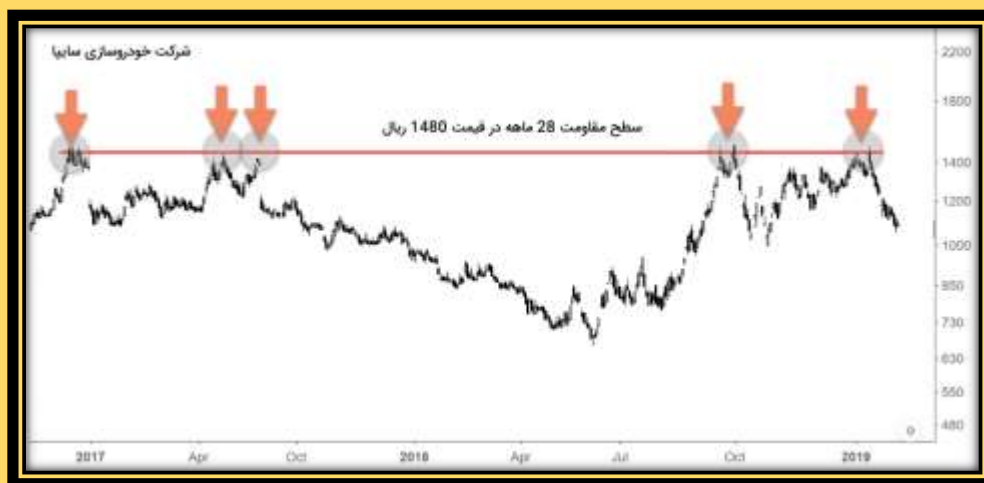
شکل ۳-۴ سطوح مقاومت در تکنیکال در نمودار شرکت خودروسازی سایپا

نمودار زیر تغییرات ارزش سهام شرکت خودروسازی سایپا در طی یک دوره‌ی ۳۰ ماهه را نشان می‌دهد. زمانی عرضه نسبت به تقاضا افزایش یافته و جلوی افزایش قیمت گرفته شده که قیمت‌ها به سطح ۱۴۸۰ ریال نزدیک شده‌اند. به عبارت دیگر، سطح مقاومت یعنی موافقت اکثر معامله‌گران در مورد محدوده‌ای که، قیمت از سطح مذکور بیشتر نخواهد شد.